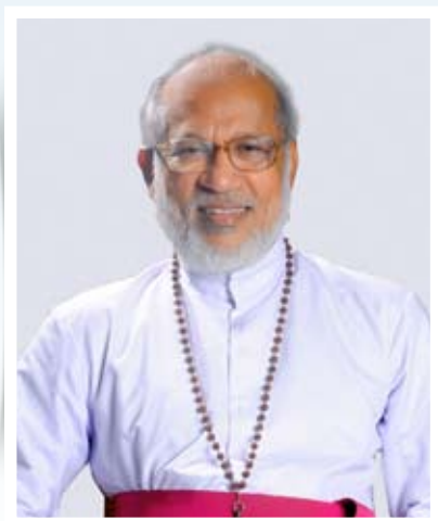
CARDINAL GEORGE ALENCHERRY (Major Archbishop Syro-Malabar Catholic Church)